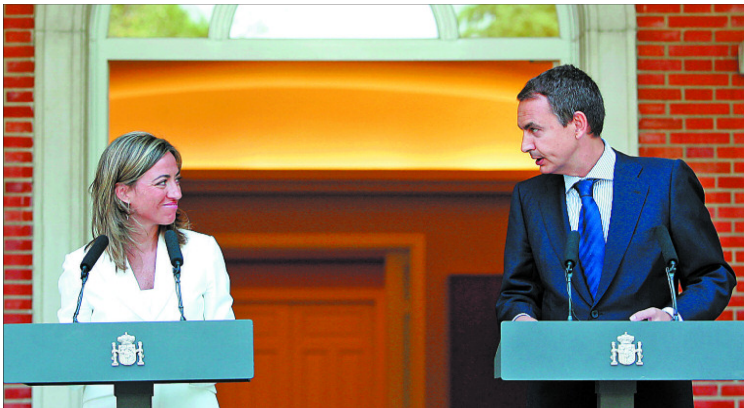
La ministra de Vivienda, Carme Chacón, junto al presidente del Gobierno, José Luis Rodríguez Zapatero, ayer al presentar el plan de alquiler.

La ayuda de 210 euros es el principal pilar del plan y, aunque el Gobierno lo presentó como la gran medida de impulso al alquiler, ya existe algo muy parecido. El 16 de julio de 2004, el Consejo de Ministros aprobó el Plan de Medidas Urgentes en Materia de Vivien-